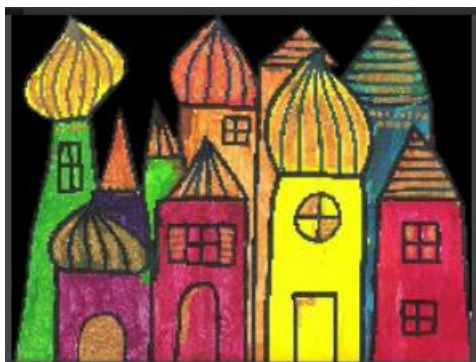
Slika 2 Chassillan, M. (2021). Les couleurs | CE2 | Fiche de préparation (séquence) | arts plastiques. Edumoov. https://www.edumoov.com/fiche-de-preparation-sequence/334839/arts-plastiques/ce2/les-couleurs

Selo se tada može izrezati i zalijepiti na crni list kako bi se istaknule boje.